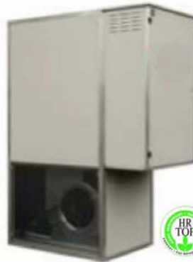
EXTÉRIEUR X E

GAZ A CONDENSATION POUR STRUCTURE GONFLABLE 60 > 350 kW