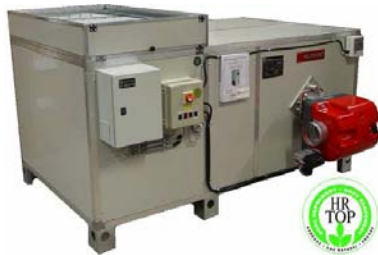
HORIZONTALAUX X O