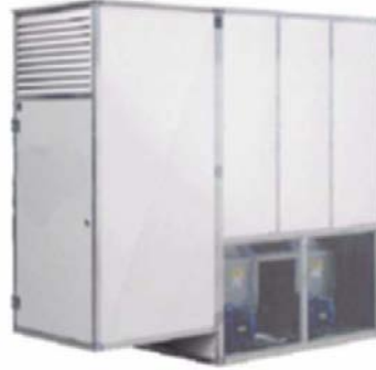
EXTÉRIEUR SES E