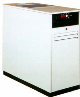
DOMUS - FORNELLA