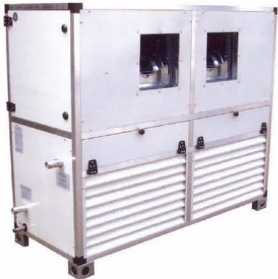
TV - TO