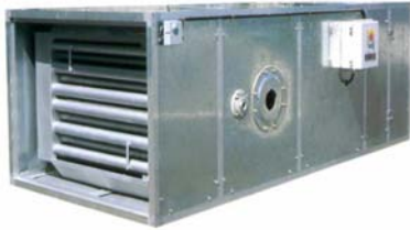
HORIZONTALAUX SES H